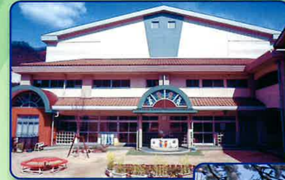
幼稚園さくらキャンパス (現・昭和幼稚園)