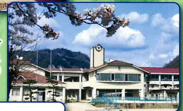
1-5アクティブ キャンパス (現・昭和小学校)