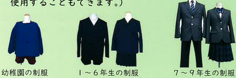
幼稚園の制服 1～6年生の制服 7～9年生の制服

A. 1～6年生は現在の昭和小の制服を、7～9年生は現在の昭和中の制服の着用を基本とします。(1～6年生でも、昭和中の制服又は昭和中の制服に準じた制服を使用することもできます。)