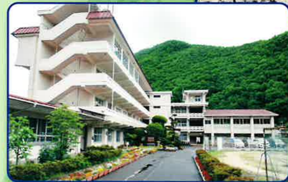
6-9フロンティア キャンパス (現・昭和中学校)