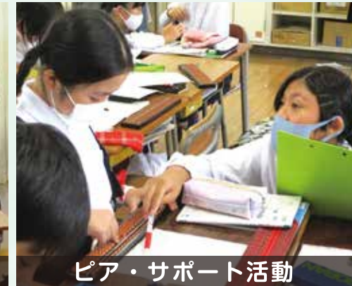
ピア・サポート活動