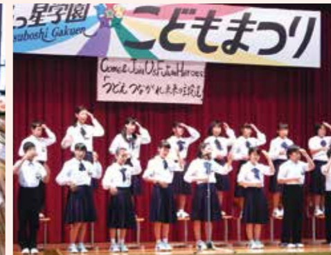
五つ星学園こどもまつり