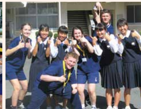
オーストラリア姉妹校との交流