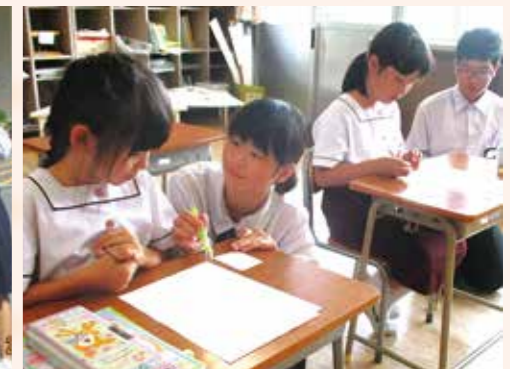
ピア・サポート活動