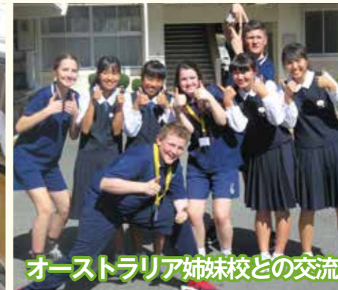
オーストラリア姉妹校との交流