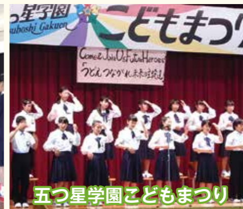
五つ星学園こどもまつり