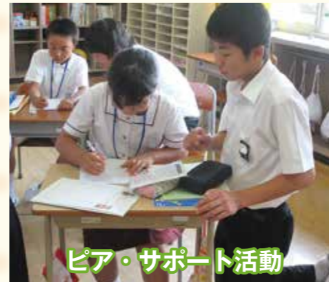
ピア・サポート活動