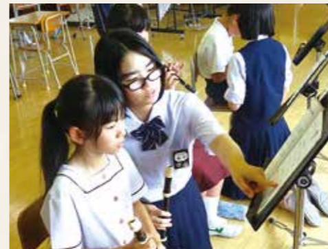
ピア・サポート活動