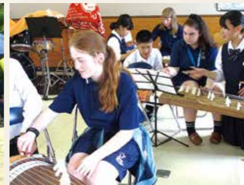
オーストラリア姉妹校との交流